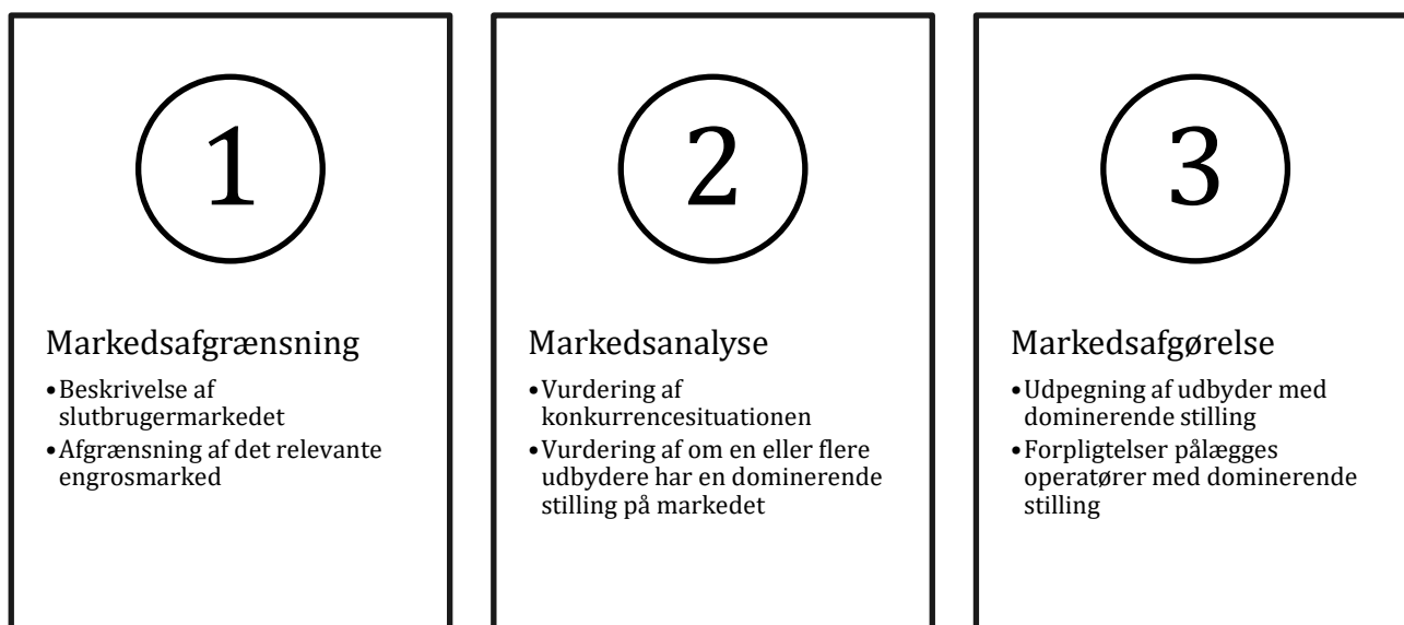
Figur 1 Markedsundersøgelsens faser

udbydere med en dominerende stilling. I afgørelsen udpeges en eller flere udbydere som har en dominerende stilling på markedet og disse udbydere pålægges en eller flere forpligtelser, jf. § 23 i.