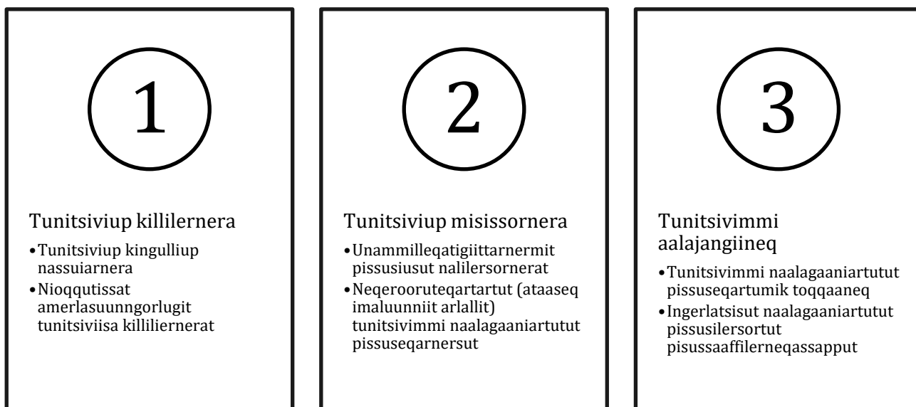
Figur 1 Tunitsivimmi misissuinerup immikkoortui

Allakkami uani immikkoortut pingasut tamakkerlugit ilanngunneqarput, tamatumani tunitsiviusuni aalajangiineq sammineqarluni, tassalu nioqqtissat amerlasuunngorlugit tuniniaaviini VoIP-attaveqaatinik pisortat nalunaarasuartaatikku ingerlataannik killilersuutit pineqarlutik.